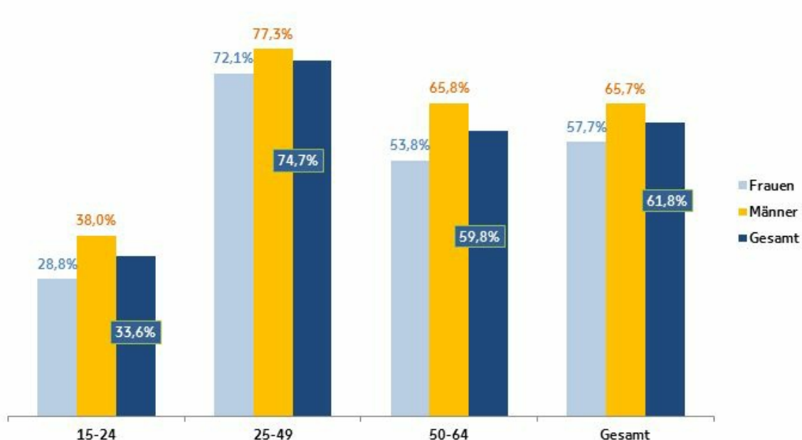
Erwerbstätigenquote (Beschäftigungsrate) in Ostbelgien 2016

Trotz der niedrigeren Arbeitslosigkeit in Ostbelgien ist die Erwerbstätigenquote hier auch 2016 etwas niedriger (61,8%) als im Landesdurchschnitt (62,2%). In den Altersgruppen 15-24 Jahre und 50-64 Jahre verzeichnet die Deutschsprachige Gemeinschaft eine höhere Beschäftigungsrate als Belgien insgesamt, in der der Gruppe der 25-49-Jährigen allerdings eine leicht niedrigere Quote. Gerade hier aber macht sich auch das Problem der mangelhaften Erfassung der Auspendlerzahlen bemerkbar.