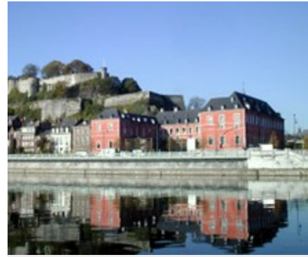
Wallonisches Parlament in Namur

Laut Artikel 139 der Verfassung kann die Deutschsprachige Gemeinschaft Regionalbefugnisse ausüben.