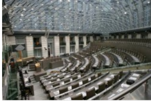
Flämisches Parlament - Plenarsaal